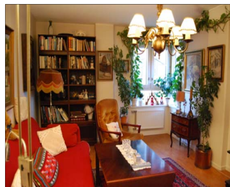
スウェーデンの高齢者ケア住宅の内装