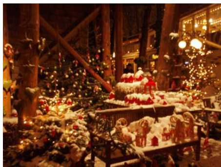
北欧の華やかなクリスマスムード