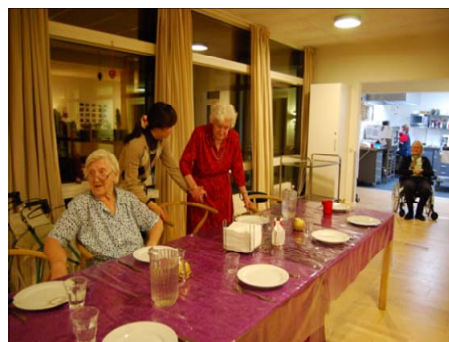
デンマークのグループホーム生活