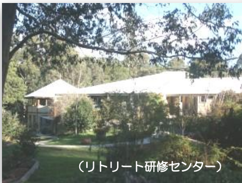
(リトリート研修センター)

リトリートとは・・・ 仕事や家庭生活などの日常生活から離れた環境のなかでゆっくりとリラクゼーションして過ごし、身体や心の動きのバランスを測り、自然との調和のなかで、心身共にリフレッシュすることです。